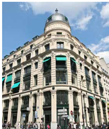
34 rue du Louvre - 75001 Paris