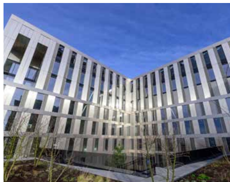
81 rue Mstislav Rostropovitch - 75017 Paris