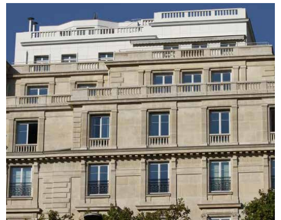
136 avenue des Champs Elysées - 75008 Paris