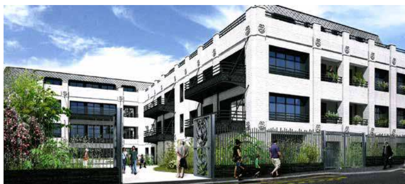
114 avenue Henri Barbusse - 92600 Asnières sur Seine VEFA