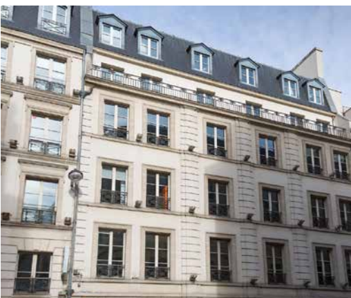
94 rue de Provence - 75009 Paris