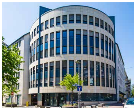
BBW – Grafstrasse / Wildungerstrasse Francfort - Allemagne