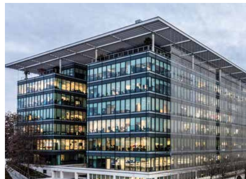
La Mahonia 2 - Madrid - Espagne