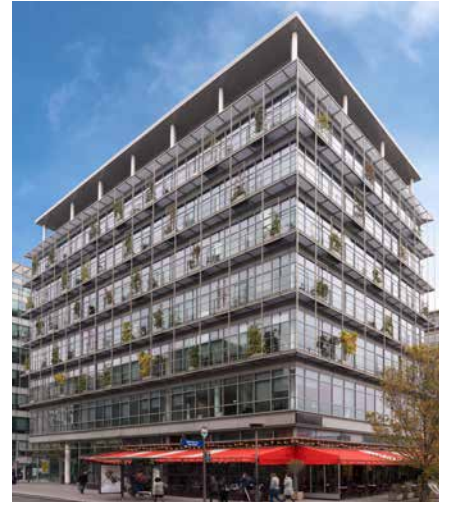
Parc Avenue - 82-90 avenue de France - 75013 Paris