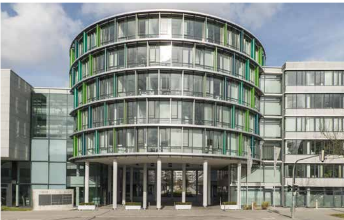
Loopsite - Werinherstrasse 78,81,91 D 81541 - Munich - Allemagne