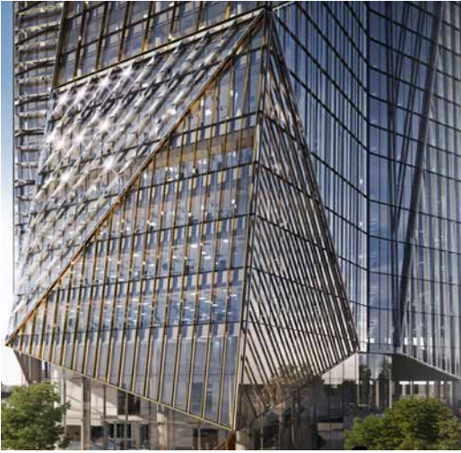
Tour Hekla - Avenue du Général de Gaulle La Défense 92800 Puteaux - VEFA