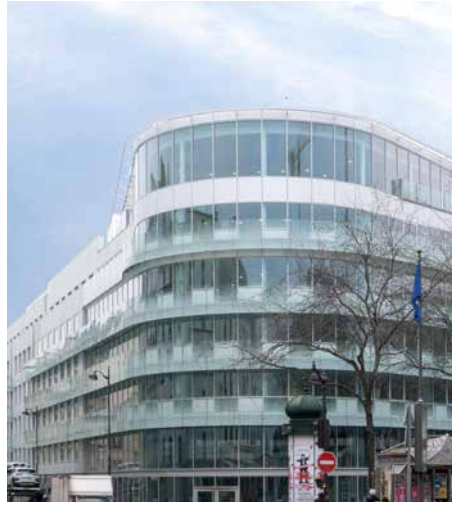
Intown - Place de Budapest 75009 Paris