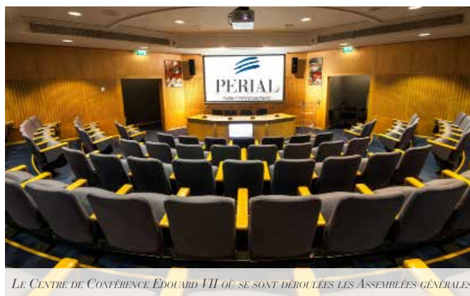
LE CENTRE DE CONFÉRENCE EDOUARD VII OÙ SE SONT DÉROULÉES LES ASSEMBLÉES GÉNÉRALES