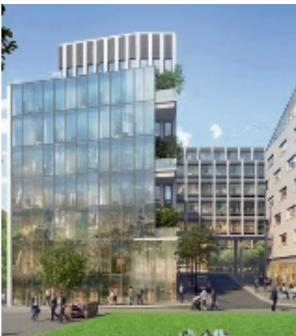
ZAC Porte Poucher - 75017 Paris (VEFA)