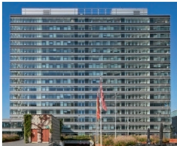
Prinses Beatrixlaan 5-7 - la Haye (Pays-Bas)