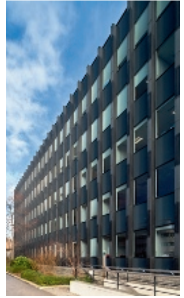
20 rue Hector Malot - 75012 Paris