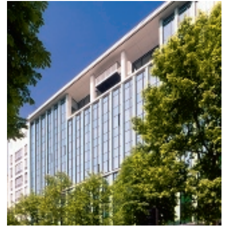
Horizons 17-140 boulevard Malesherbes 75017 Paris